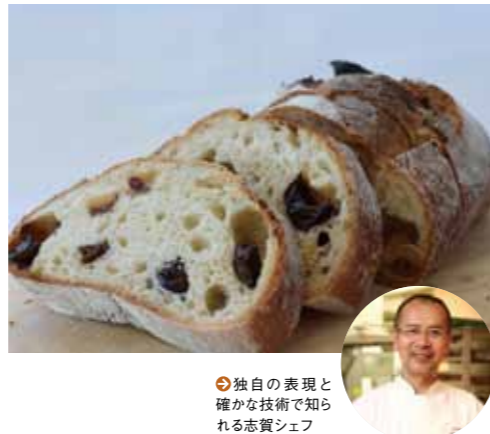
レザン エシトロン 3,800円(税込) 予約販売商品

リピーター続出! パン好きが毎回楽しみにしている限定パン。今回は、サーワクリーム、クリームチーズ、はちみつを配合したしっとりとした生地に、国産ぶどうとレモンピールを入れて焼き上げ、ぶどうの優しい甘さとレモンの爽やかな香りが広がる極上の一品。