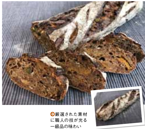
Pan au Tea 3,240円(税込) 予約販売商品

レストランを併設している軽井沢に本店を持つ名店。今回のフェスでも初日21日に出店する。紅茶パウダー、アールグレイ茶葉を練りこんだ生地にゴールデンベリー、紅茶で煮たイチジク、ホワイトチョコ、ナッツをふんだんに混ぜ焼き上げた逸品。食べた瞬間、口いっぱいに紅茶の香りが広がる!