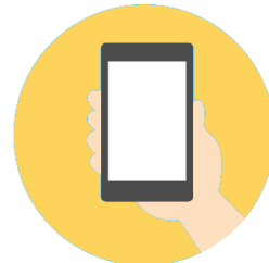
＜COCOAなど アプリ登録推奨＞